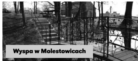
Wyspa w Molestowicach