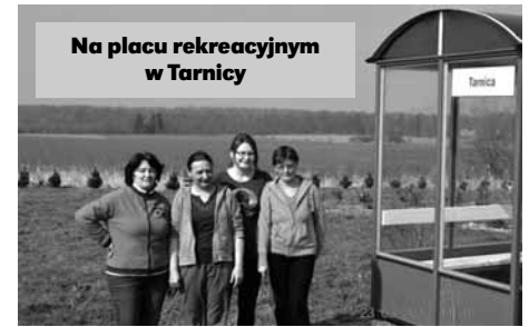
Na placu rekreacyjnym w Tarnicy