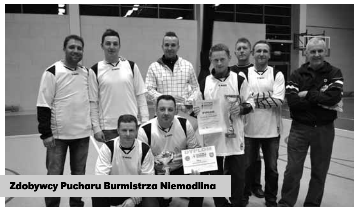
Zdobywcy Pucharu Burmistrza Niemodlina